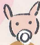
ミチトと ミントの子 2/27生

羊の赤ちゃんが2匹 2月6日にメスの赤ちゃん、3月7日 にオスの赤ちゃんが生まれました。ヒ ツジの妊娠期間は、150日ほどです。 お腹や乳房のはり度で、生まれる時期は およそで判断します。どちらの赤ちゃん も予想したより早く生まれました。 メスの赤ちゃんは、お父さんにそっく りで少し鼻先がべちゃっとなっていていま す。オスの赤ちゃんは、鼻先が少し黒っ ぽく、よく走り回ります。