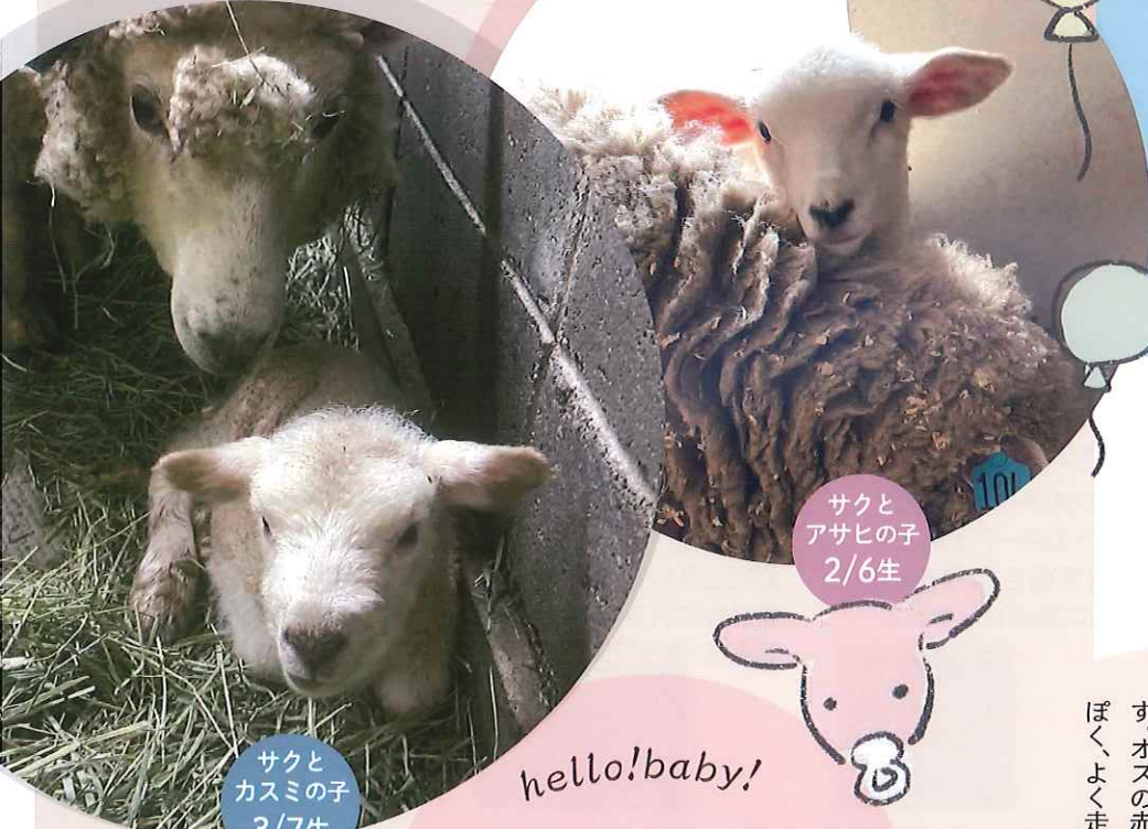
サクと アサヒの子 2/6生

五月山公園・動物園・植物園の いまを伝える五月山通信。 春のようすやイベントを伝えます